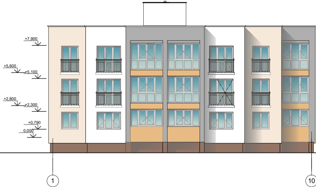
Фасад в осях "1-10"